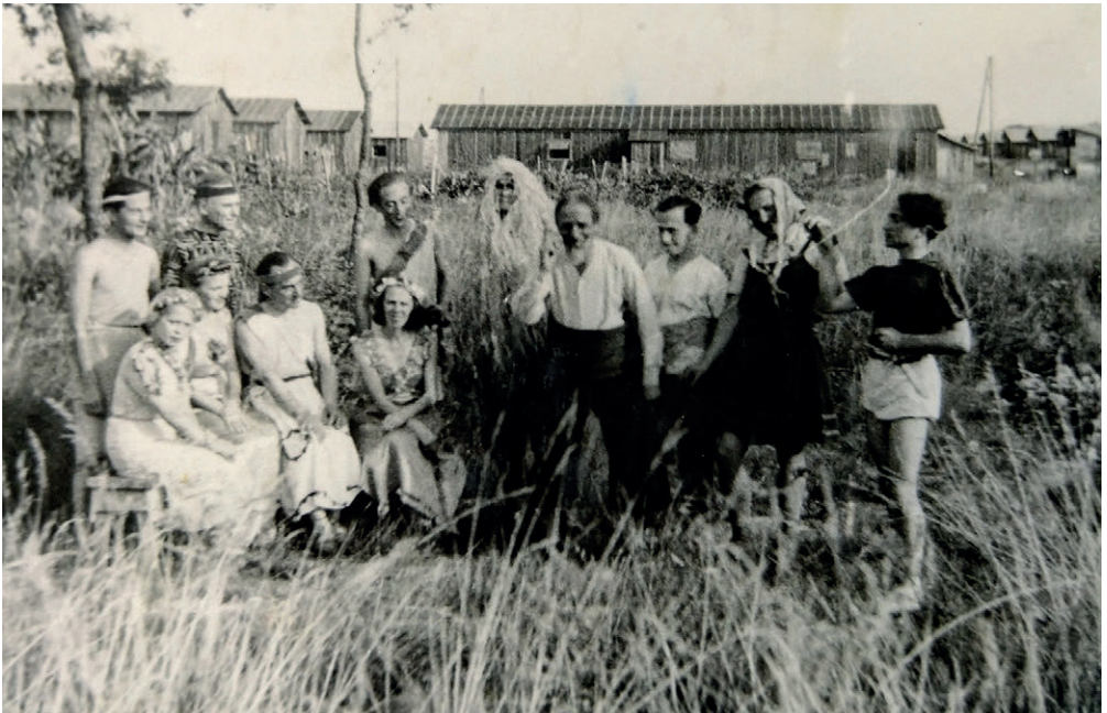
Proben zu „Ein Sommernachtstraum“ im Lager Gurs

Von dort flieht er Weihnachten 1942 über die Pyrenäen nach Spanien, wo er sich bis 1957 unter dem Pseudonym Pierre Michel als Chansonier und Unter-