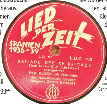
Eine der geretteten Platten mit einer Neuaufnahme der Ballade der XI. Brigade .